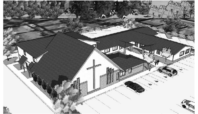
2017년 11월19일 (제22권 47호) 추수 감사절 예배

Eden Presbyterian Church of Oregon P.C.A.