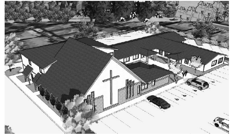
2017년 12월10일 (제22권50호) 성서주일

Eden Presbyterian Church of Oregon P.C.A.